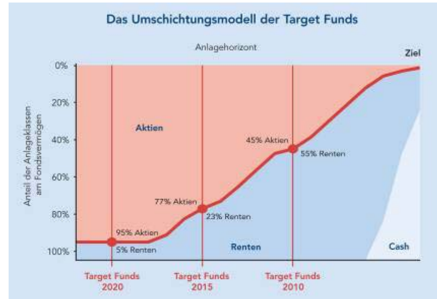
Grafik 2: Je früher, desto aggressiver: Nach einem ausgeklügelten Modell, das dem Fondsmanager als Leitlinie dient, werden die Target Funds umgeschichtet. Die zugrunde liegenden Annahmen werden regelmäßig überprüft und angepasst.

Quelle: Finanzen: Vorsorgen und zurücklehnen, Ausgabe 12/04