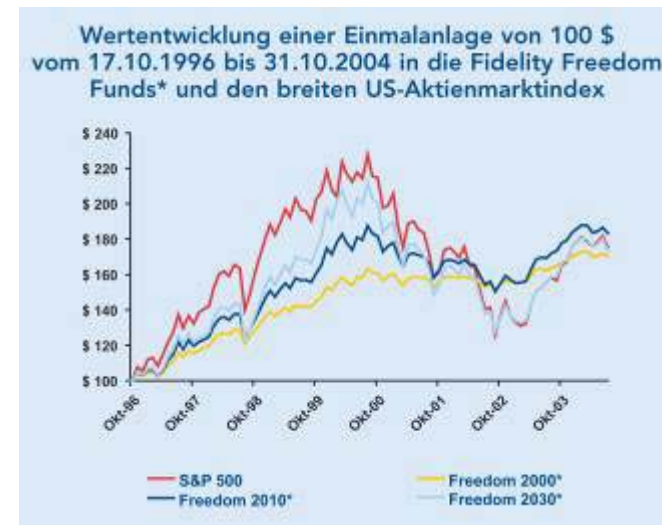
Grafik 6: Die Freedom Funds dienen den Target Funds als Vortage und sind für deutsche Anleger nicht erhältlich. Quelle: FMR, Wertentwicklung einer Einmalanlage von 100 US $ vom 17.10.1996 (Auflegung des Freedom 2010 Euro Fund) bis 31.10.2004