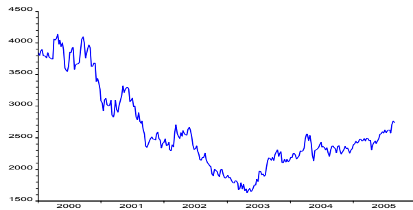
MSCI Pacific (Performanceindex in EUR)